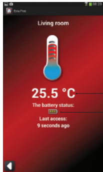
Представление датчика в мобильном приложении

RCT-01 универсальный беспроводной датчик температуры с батарейным питанием. Протокол работы согласно устройств Exta Free. Датчик работает только с контроллерами EFC-01 и EFC-02. В случае работы с EFC-02 возможна только визуализация значения температуры на мобильном устройстве. При работе с EFC-01, измеряемое значение температуры можно дополнительно использовать в процессе управления, например в системах отопления и кондиционирования. Датчик характеризуется малыми размерами и приспособлен для монтажа в монтажной коробке. Разрешается также настенный монтаж при помощи двухсторонней клеящей ленты или монтажного клея.